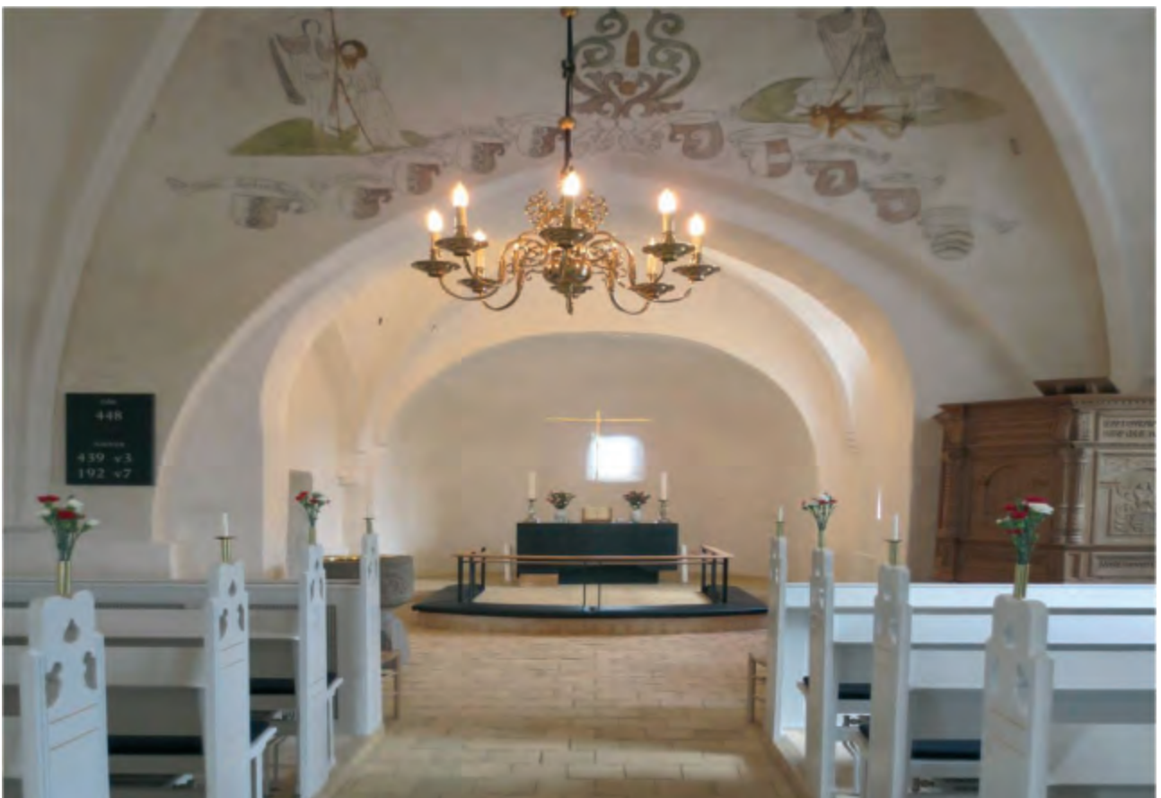
Nymalet interiør - klar til tjeneste.