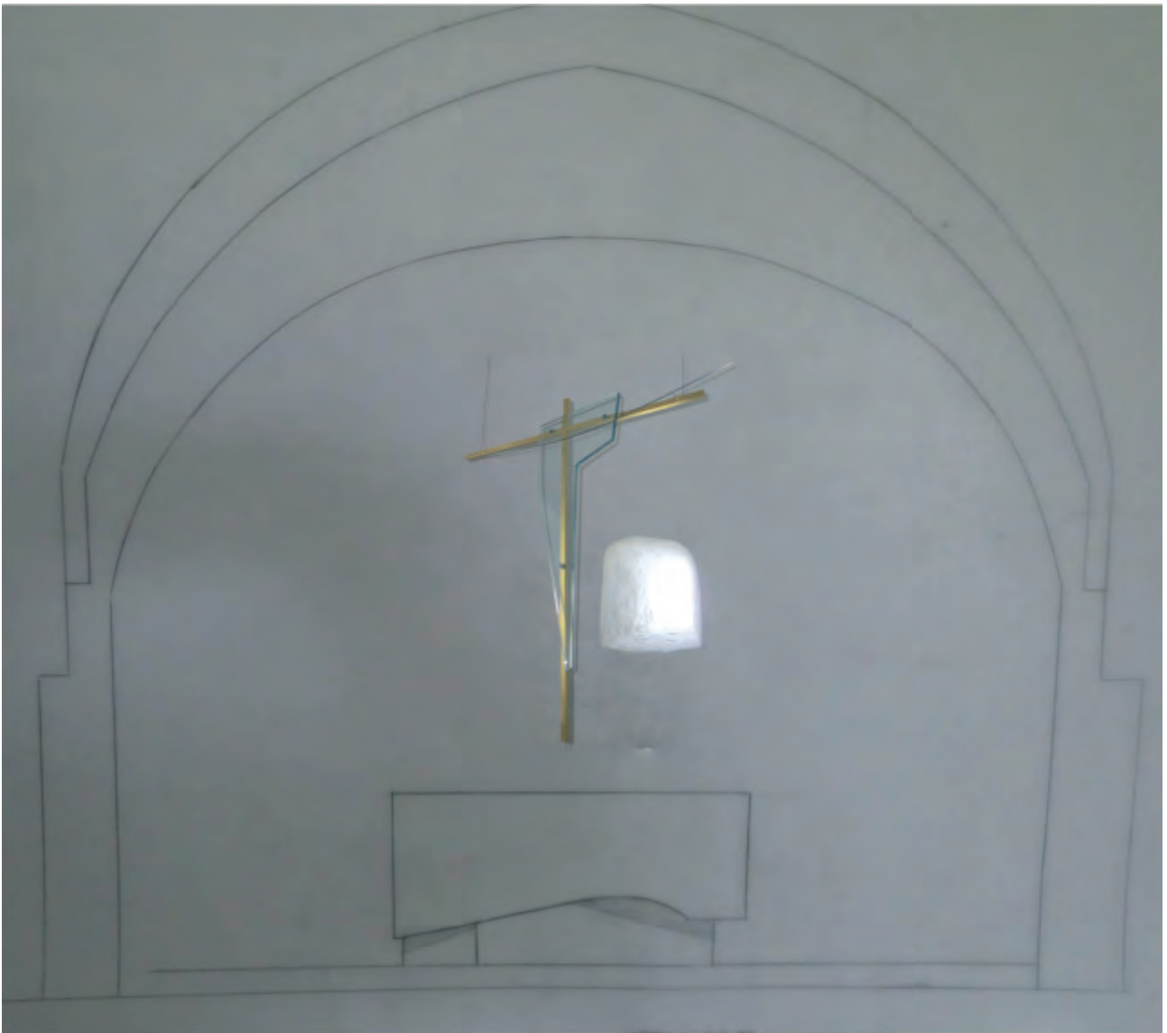
Skitsen af korbuen, vi blev præsenteret for, her med kors og nyåbnet vindue indkopieret.