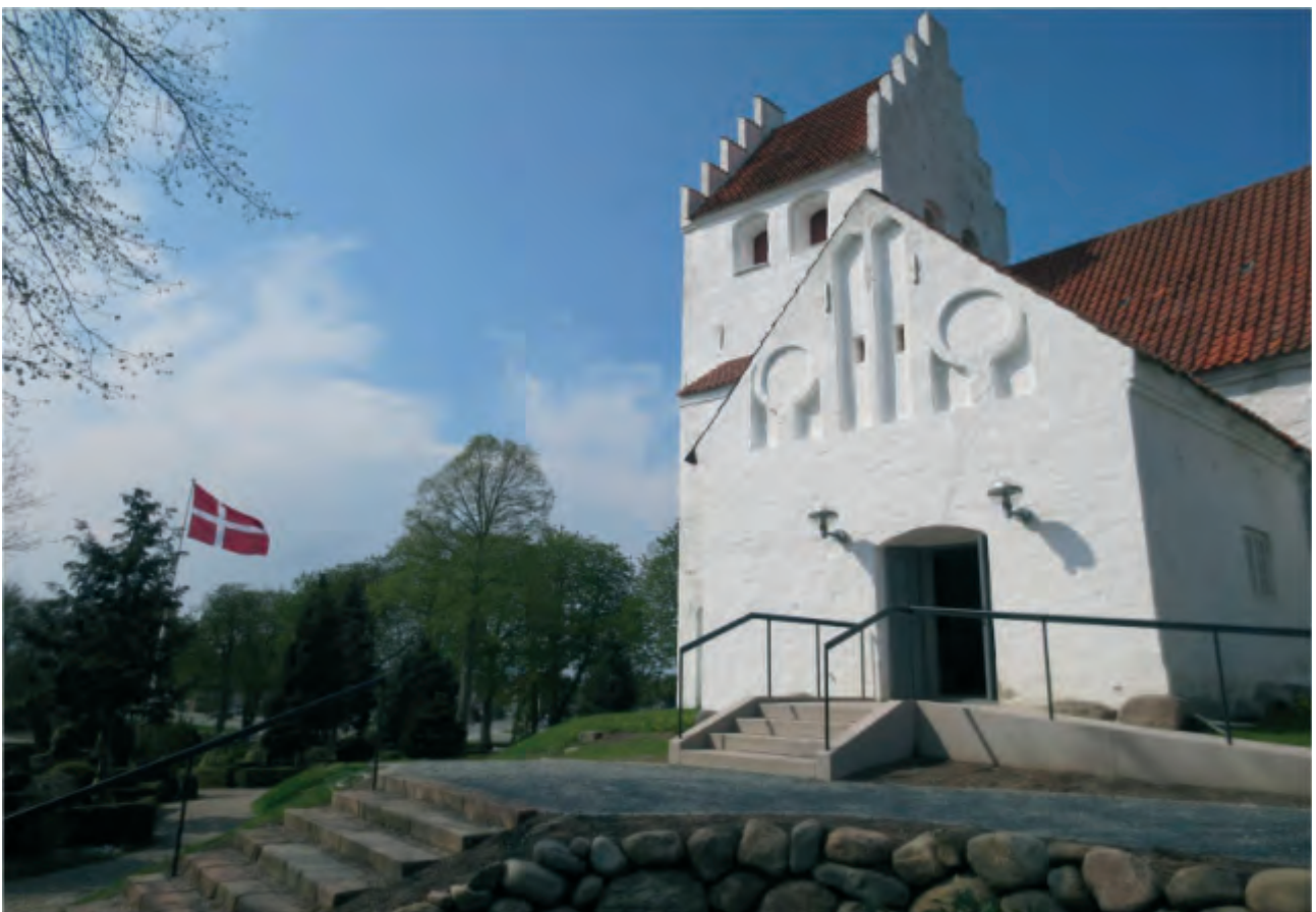
Nydeligt arbejde med trapper og rampe.