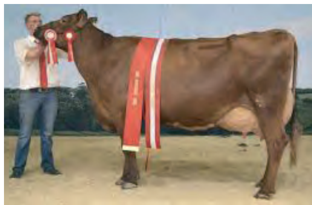
”modelkøer” fra hvert sin periode. Til venstre fra 1913, til højre fra 2016.