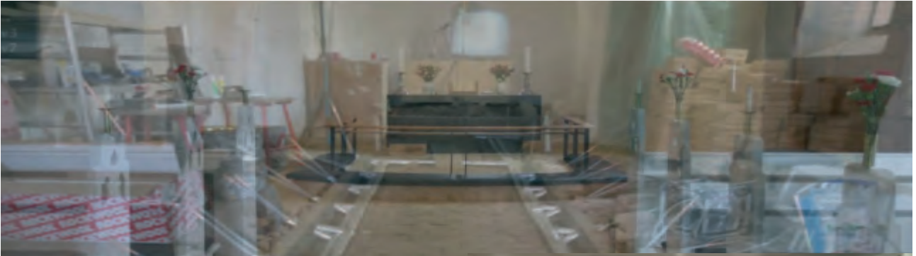
Her er et røntgebillede af, hvad der gemmer sig under gulvet - og "maskineriet", der styrer det.