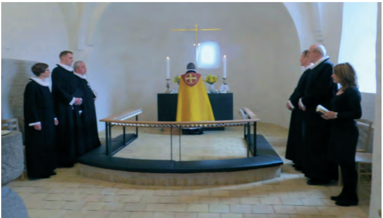
Den første afdeling af gudstjenesten stod biskop Tine Lindhardt for.