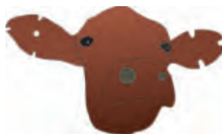
Her er vist en kalv, der er nummereret ved kantklipping. Den har fået nr. 199.

Man klippede hakker i ørerne foroven, på spidsen og forneden, og det højre øre angav 10-ere mens det venstre gav 1-ere. Hakkernes værdi var altså 1, 3 eller 5.