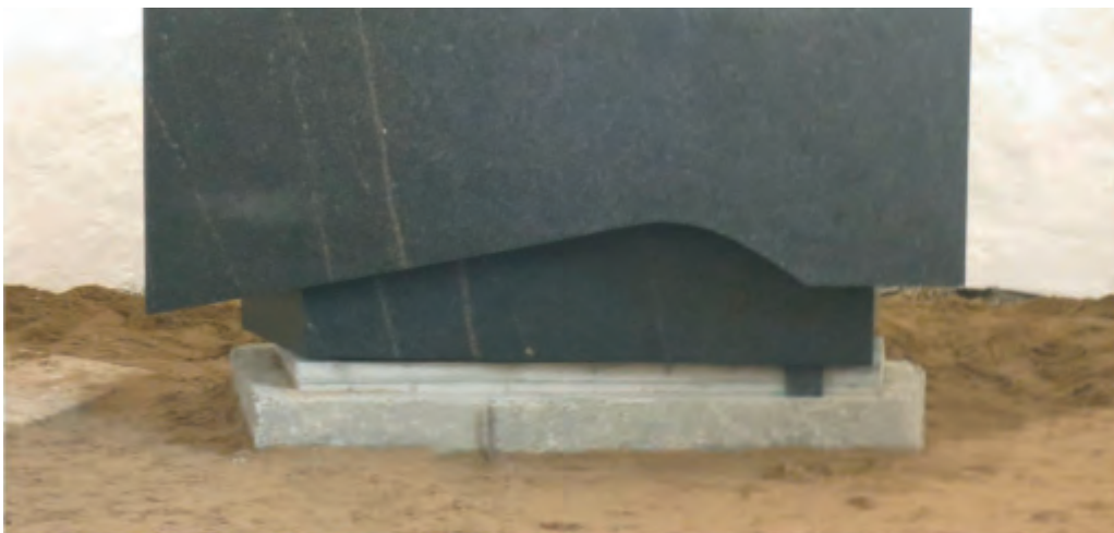
Alteret, udhugget af en enkelt stor sten af Bornholmsk granit anbragt på sit fundament.