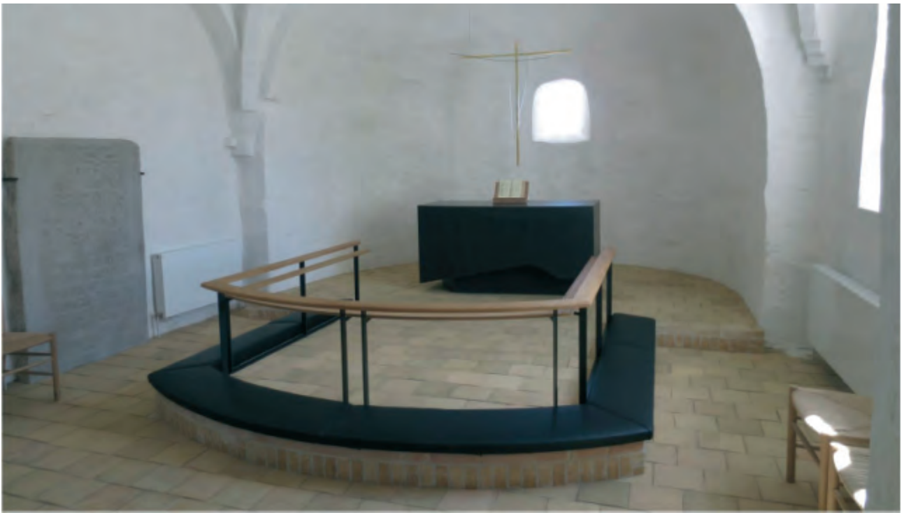
Knæfald og alter er på plads og korset hængt op.