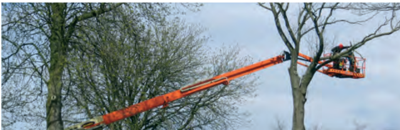
Som forberedelse - en himmelsk gerning?

Der ligger en stærk symbolik i det. En konkret måde at vise på at solopgangen fra det høje kaster sine livgivende stråler over Jer og lyser ind i Jeres kirke.