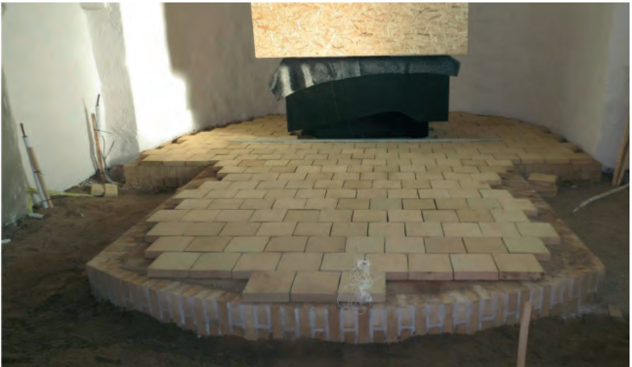
Så kom alteret på plads, og knæfaldets basis er også ved at være på plads.