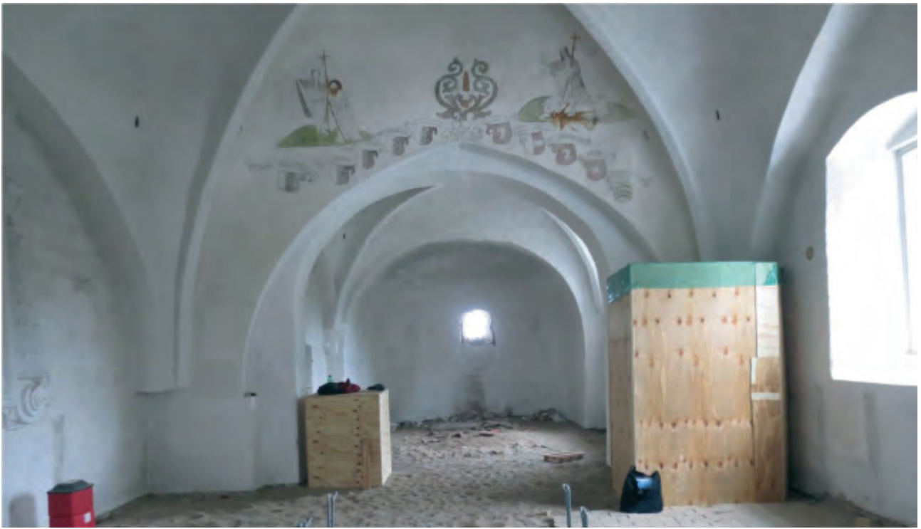
Så langt, så godt. Vinduet genfundet og pladsen ryddet og gjort parat.