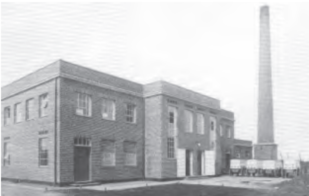
Dalum Landbrugsskoles nye mejeri, opført 1931 med bl.a. laboratorier for mælkekemi og bakteriologi.