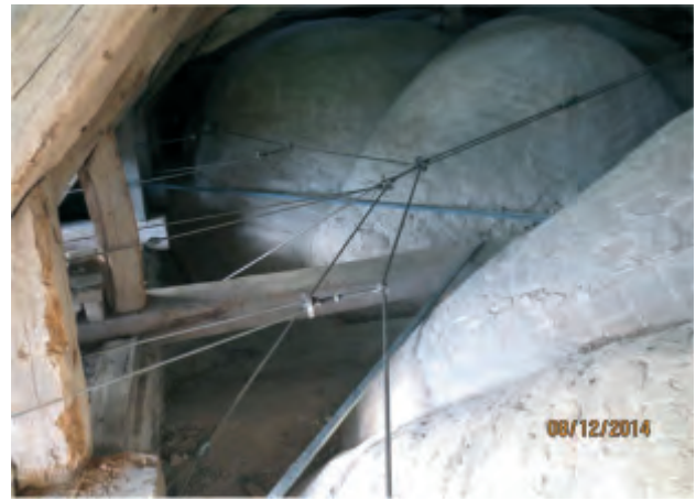
Kirken er spændt op med wirer.