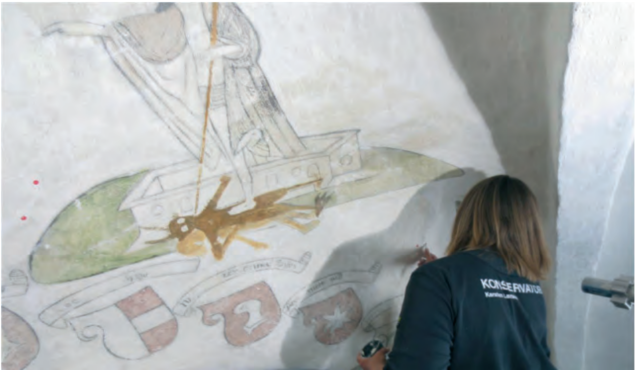
Kalkmaleriet renoveres, så det klart fremgår, hvordan djævelen spiddes.