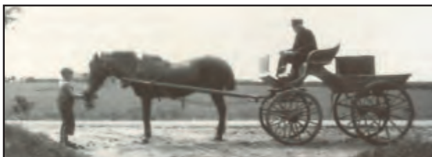
Kontrolkassen undervejs til næste gård.

Ingredienserne skulle bruges ved alle kontrolmålinger, så de blev samlet i selve kassen: "Kontrolkassen", som altså så at sige var kontrolassistentens transportable redskabsrum. Den indeholdt desuden også en centrifuge og en skålvægt. Af andre af kontrolassistentens redskaber kan nævnes Den sorte bog , Den gule bog og en bismervægt.