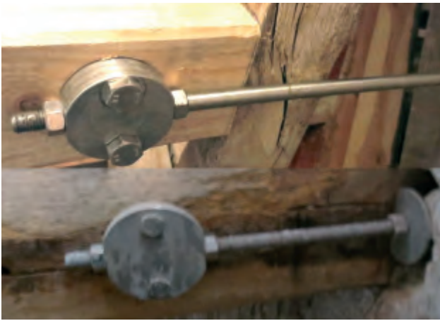
Gamle beslag på gammelt tømmer erstattes af nyt.