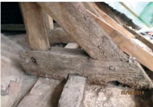
Gammel og ny mødes billedligt - men der er mere tale om erstatning af gammelt med nyt.